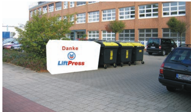
Anwendungsbeispiel: So schnell sparen Sie Platz und Geld

*Hubwagen in geprüfter Qualität; auch als Transporter, Hebebühne oder fahrbares Gerüst nutzbar. Und dabei durchaus bezahlbar.